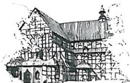
Kościół Pokoju pw. Św. Trójcy Wpisany na listę UNESCO