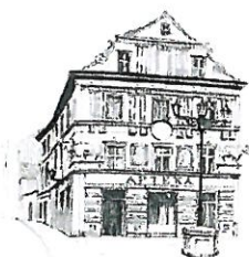
Kamienica „Pod Bykami”